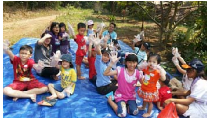
Holabar Kids di Tangerang (28 September 2014) Pengenalan Sayur Organik dan Permainan untuk Anak