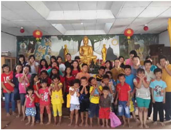
Tur Buddha Anupamadana (24 Agustus 2014) Vihara Dhamma Metta, Tangerang