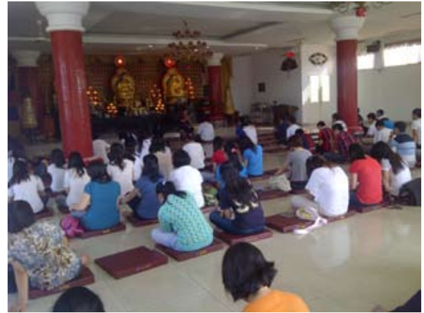
Tur Buddha Anupamadana (22 Juni 2014) Vihara Buddhasena, Bogor