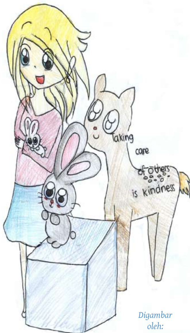
Digambar oleh: Aurora

Kadang yang dibutuhkan orang itu hanya kehadiran kita, just be there , tidak perlu bicara apa-apa, datang, pegang tangannya, tidak perlu berbicara macam-macam, sampaikan bahwa “ i am here for you ” dengan hati yang tulus.