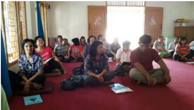
Tur Buddha Anupamadana (28 September 2014) Cetiya Veluvana Arama, Tangerang