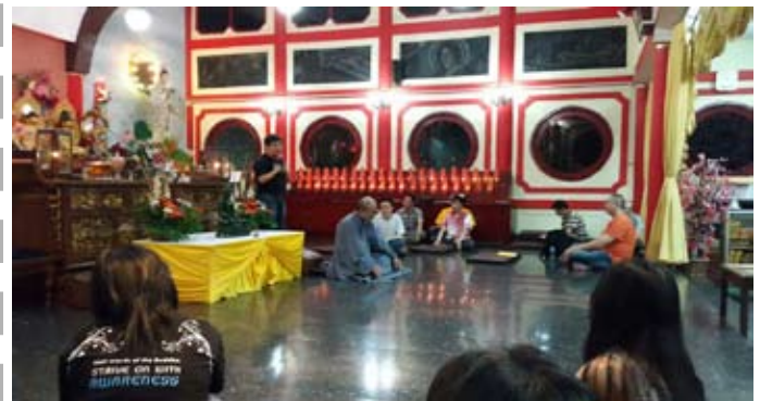
Tur Buddha Anupamadana (25 Oktober 2014) Vihara Tanda Bhakti, Bandung