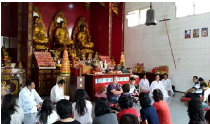
Tur Buddha Anupamadana (26 Oktober 2014) Vihara Dewi, Bandung