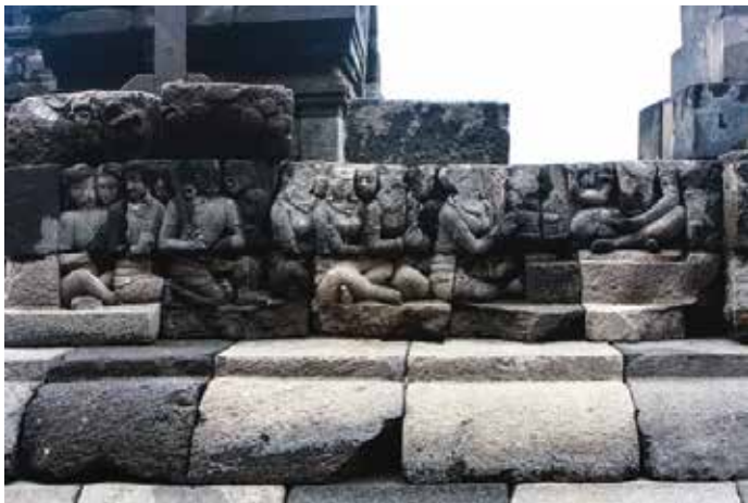
Relief 107. Kshantivadin sedang memberi ajaran kepada para selir.

Kisah ini diukir di Candi Borobudur pada lantai 1, dinding langkan, deretan atas, relief no. 103-107.