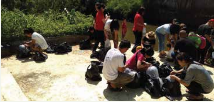
7 Maret 2019. Abhaya-dana & Puja. Cipondoh, Tangerang.