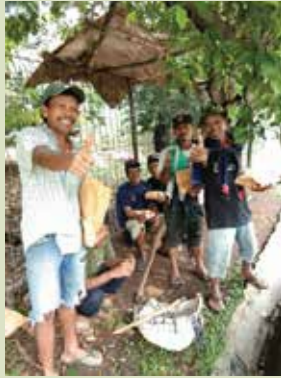
28 April 2019. "Masak Bersama dan Berbagi dalam Rangka Hari Waisak." Cipondoh, Tangerang.