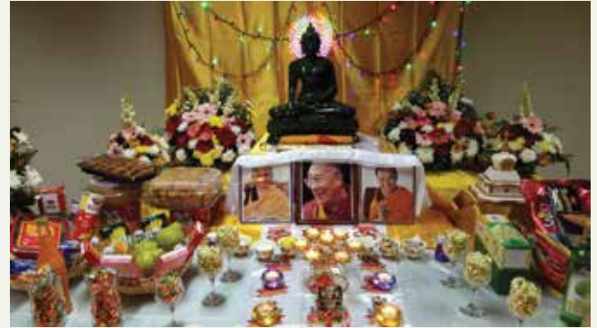
19 Mei 2019. Puja Waisak. Training Room, Taman Anggrek, Jakarta Barat.